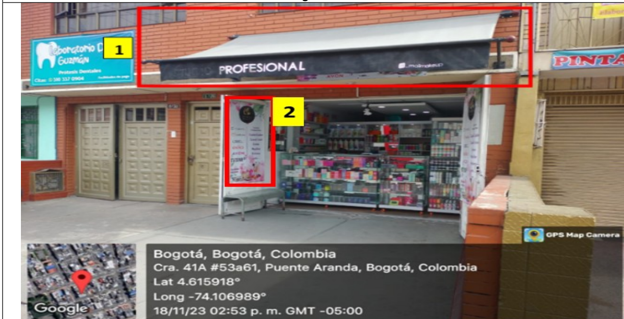
Fotografía No. 4

En la cual se evidencia un (1) elemento no autorizado tipo (parasol o carpa) según artículo 29 del decreto 959 del 2000 identificado con el número 1, el cual contiene publicidad, así mismo un (1) elemento PEV ubicado en la puerta del establecimiento comercial descrito con el número 2.